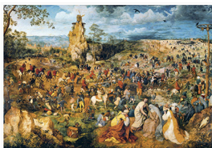
Символическое изображение ветряной мельницы в картине П. Брейгеля Старшего «Несение Креста». 1564. Художественно-исторический музей (Вена).

Паровые М. появились в Великобритании в 1800, на рубеже 19 – нач. 20 вв. вытеснены М., работающими на электромеханических и электрических приводах.