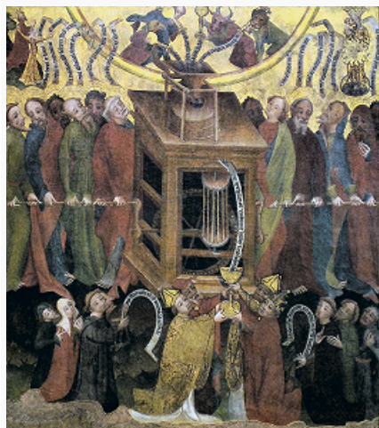
«Евхаристическая мельница». Фрагмент алтаря собора цистерцианского монастыря в Бад-Доберане (Мекленбург, Германия). 14 в.

Образ М. играет важную роль в мифологии и искусстве. Непрерывное круговое движение М. стало метафорой всё перемалывающего времени или судьбы («М. Фортуны»). Характерны мифологич. и сказочные сюжеты о чудесных М., из которых получается богатство, счастье (напр., Сампо в финской мифологии или зернотёрка Гротти в «Старшей Эдде») либо, напротив, несчастья, войны, болезни и т. п. Распространена ассоциация М. со смертью; в ср.-век. католицизме она стала символом жертвенной смерти Христа (напр., в «Несении Креста» П. Брейгеля Старшего ) и Евхаристии («евхаристическая», «мистическая» М., или М. гостей, изображающая превращение зерна в хлеб для причастия – гостию). Распространение водяных М., приведшее к появлению проф. мельников, связало их занятие с романтич. темой «вечно текущей» воды (напр., цикл «Прекрасная мельничиха» Ф. Шуберта ).