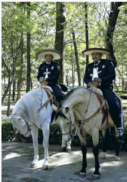
Мексиканские полицейские в костюмах чарро. Парк Аламеда (Мехико). 2010.