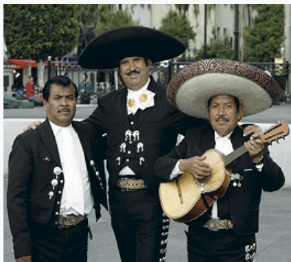
Ансамбль марьячи.

позитив. формах) включает песни и танцы, занесённые из Испании ( вильянсико , валона, карамба, сандунга, фанданго , сапатеадо и др.), и специфич. песенно-танцевальные формы, среди которых наиболее популярны сон, уапанго, харабе в исполнении певцов и инструментальных ансамблей марьячи. В составе последних – скрипки, гитары, хараниты и гитарроны, большая беспедальная арфа (т. н. креольская), трубы или кларнеты, тромбон; ансамбли марьячи исполняют также нар. и популярную авторскую музыку. Повсеместное распространение приобрели вальс и данса (или хабанера ), попавшая в Мексику с Кубы (сер. 19 в.). В песенном фольклоре, наряду с многообразными лирич. формами, значит. место занимают патриотич. и историч. песни, среди них – корридо (песня