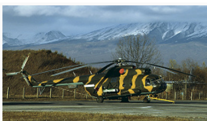
Вертолёт Ми-8Т в камуфляжной

М. применяется с глубокой древности, но использование методов и приёмов М. долгое время было примитивным, случайным и зависело гл. обр. от хитрости, изобретательности и таланта отд. полководцев. Необычайно быстрое и активное развитие средств наблюдения (особенно воздушного) в сочетании с возросшими мощностью, меткостью и дальностью всех средств огневого поражения в ходе 1-й мировой войны заставило все армии мира уделить большое внимание вопросам М. В