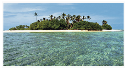
Один из атоллов Маршалловых островов.

Естеств. растительность почти не сохранилась, лишь на нескольких островах остались небольшие лесные массивы. Внутренние лагуны атоллов обрамляют мангровые заросли. Произрастает ок. 80 видов растений. Широко распространены насаждения кокосовой пальмы (занимают ок. 60% площади суши), хлебного дерева, бананов. Почвы на коралловых песках слаборазвитые, щелочные, малоплодородные, плохо удерживают влагу и питат. вещества. Животный мир беден, все 9 видов млекопитающих (рукокрылые и грызуны) индуцированы на острова в разные годы. Из пресмыкающихся водятся змеи, ящерицы (особенно многочисленны сцинки и гекконы). Морская черепаха бисса и зелёная черепаха, ранее широко распространённые на атоллах, встречаются редко. Разнообразна фауна птиц – 106 видов, в осн. морских, многие из которых образуют птичьи базары. Прибрежные воды изобилуют рыбой (ок. 250 видов), разнообразны кораллы (св. 140 видов). Охраняемые природные территории отсутствуют. Атоллы Бикар и Таонги (Бокак) – единственные в мире с сохранившимися естественными экосистемами и большой популяцией морских зелёных черепах; в 2010 объявлены участками Всемирного наследия .