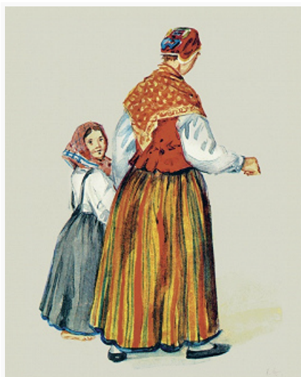
Ливская женщина с девочкой из Колки (Северная Курземе). Акварель А. Пецоляда. 1846. Архив Русского географического общества (С.-Петербург).

В 1920–30-е гг. в Латвийской республике записывались произведения ливского фольклора, изучался ливский яз. Наряду с этим шло активное размывание традиц. культуры Л.