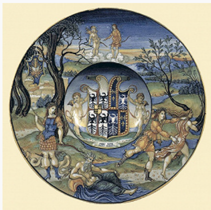
Николо да Урбино. Майоликовое блюдо. Ок. 1525. Британский музей (Лондон).

После завоевания Америки произ-во М. стало осваиваться в исп. колониях (ок. 1540).