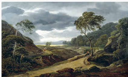
Антонин Манес. «Горный пейзаж». Национальная галерея (Прага).

МÁНЕС (Mánes), семья чеш. живописцев и графиков.