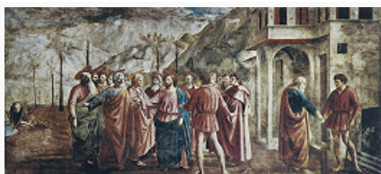
Мазаччо. «Чудо со статиром».