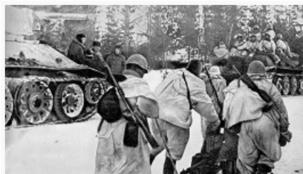
Выдвижение советских войск на исходные позиции для наступления. Фото. 1943.

удары по батареям, обстреливавшим Ленинград. В июне обстрелы города резко сократились, а к октябрю их интенсивность уменьшилась в 3–4 раза. Под Ленинградом зародилось массовое снайперское движение (указом Президиума ВС СССР от 6.2.1942 десяти лучшим снайперам Ленингр. фронта присвоено звание Героя Сов. Союза, а 130 награждены орденами и медалями), активную борьбу вели партизаны, отвлекая значит. силы врага с фронта. Попытки деблокады Ленинграда в 1942 (наступления на любанском направлении в январе – апреле и на синявинском направлении в августе – октябре) из-за недостатка сил и средств, недочётов в организации успеха не имели, однако эти активные действия сов. войск сорвали готовившийся новый штурм города. Контрнаступление сов. войск в ходе Сталинградской битвы 1942–43 вынудило герм. командование перебросить часть войск из района Ленинграда, что создало благоприятную обстановку для его деблокады.