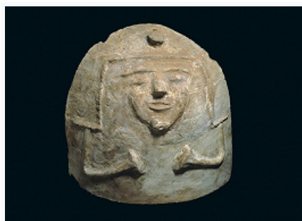
Лахиш. Крышка гроба. Глина. 13 в. до н. э. Британский музей (Лондон).

Л. идентифицирован амер. археологом У. Олбрайтом в 1929 с городищем Телль-эд-Дувейр (иврит – Тель-Лахиш, М. R.135108 по израильской топомаркировке) в 40 км к юго-западу от Иерусалима, что позднее подтвердили раскопки. Холм (пл. основания ок. 12 га; почти прямоугольной вершины – более 7 га) со всех сторон окружён обрывистыми склонами, кроме юго-зап. угла, где, как правило, располагались мощные ворота; для обеспечения водой имелись колодцы (один изучен в сев.-вост. углу города). Раскопки англ. археологов (Дж. Л. Старки, О. Тафнелл, Дж. Л. Хардинг) в 1932–38, израильских в 1960-х гг. (И. Ахарони) и 1973–87 (Д. Уссишкин). Есть материалы эпох керамического неолита (5500–4500 до н. э.), энеолита (4500–3300 до н. э.) и с начала бронзового века (ок. 3300–3000 до н. э.) до периода эллинизма. Выделены 7 уровней обживания и слои 5 пожаров, уничтожавших Лахиш.