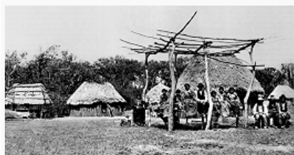
Деревня кэддо на Индейской территории. Фото У. Суля. 1869–73. Смитсоновский институт (Вашингтон).