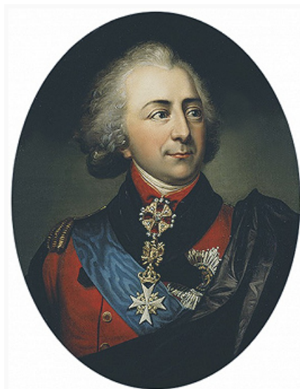
И. П. Кутайсов. Портрет работы неизвестного художника. Кон. 18 – нач. 19 вв. Эрмитаж (С.-Петербург).