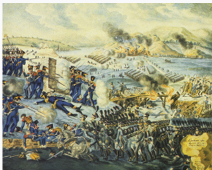
«Сражение при Кульме в августе 1813 года». Художники В. С. и А. С. Норовы. 1814. Исторический музей (Москва).

КУЛЬМСКОЕ СРАЖЕНИЕ 1813, сражение между войсками союзной Богемской армии и франц. войсками, произошедшее 17–18(29–30) авг. близ Кульма (ныне Хлумец округа Усти-над-Лабем Устецкого края, Чехия), в ходе заграничных походов российской армии 1813–14 .