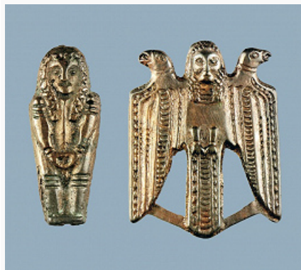
Кулайская культура. Бронзовые литые фигурки из Холмогорского клада. Кон. 3–4 вв. Сургутский

Небольшие (400–3400 м 2 ) городища; укрепления включали ров и частокол, позднее – дерев. двойные стены, башни или «бастионы». Селища с замкнутой планировкой, хутора. Наземные слабо углублённые постройки и полуземлянки каркасно-столбовой или срубной конструкции, со стенами, присыпанными землёй, с очагом в центре (в т. ч. с дерев. каркасами, иногда на песчаных «подушках») и кострищами-дымокурами близ входа. Выявлены площадки для литья бронзовых изделий. Погребения на площади городищ и селищ (Сургутское Приобье) и в удлинённых курганах (Верхнее и Среднее Приобье), образованных в результате присыпки после очередных захоронений; грунтовые могильники с трупоположениями (в т. ч. вторичными) и трупосожжениями на стороне (прах помещали, вероятно, в ёмкость из органич. материалов). Трупоположения вытянутые, ориентированы головой на северо-восток, в ямах с древесным перекрытием (известны также захоронения нескольких конских черепов, собаки, барана); прослежены тризны (кострища, фрагменты сосудов, целые и сломанные наконечники стрел). Святилища и клады, где находят многочисл. плоские металлич. антропоморфные изделия и личины (рис., 2, 3), иногда оружие, объёмные изображения и др.