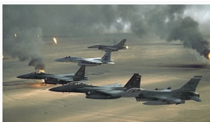
Боевые самолёты ВВС США в небе Кувейта во время операции «Буря в пустыне». Фото. 1991.

В авг. 1976 в стране разразился острый политич. кризис. Эмир Сабах III аль-Салем ас-Сабах спец. указом распустил Нац. собрание. Это вызвало массовые протесты населения, привело к активизации деятельности экстремистских исламистских организаций. Существенное влияние на обществ. настроения в К. оказала Исламская революция в Иране 1979 . Кувейтские власти, обеспокоенные размахом антиправительств. выступлений, приняли решение восстановить деятельность парламента. В февр. 1981 проведены выборы в Нац. собрание. Победу на них одержали консервативные круги, поддерживавшие курс правительства. Однако стабилизировать ситуацию в стране кувейтским властям не удалось. В нач. 1980-х гг. экономич. положение К. ухудшилось в результате резкого падения цен на нефть; в 1982–83 возник бюджетный дефицит (100 млн. долл.; впоследствии ликвидирован благодаря иностр. инвестициям). Ирано-иракская война 1980–88 , ряд терактов (1983, 1985) и покушение на эмира в 1985, организованные в К. одной из иран. экстремистских организаций, усилили внутривнутриполитич. напряжённость. Из К. стали в массовом порядке выселяться иностранцы, деятельность Нац. собрания в 1986 была вновь приостановлена.