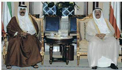
Эмир Кувейта шейх Сабах аль-Ахмед аль-Джабер ас-Сабах (справа) и наследный принц шейх Наваф аль-Ахмед аль-Джабер ас-Сабах. Фото. 17 июня 2009.

В 2003 К. оказал активную поддержку США и их союзникам в подготовке и проведении воен. операции по свержению режима С. Хусейна в Ираке. Власти К. предоставили свою территорию для развёртывания сил антииракской коалиции. В дек. 2004 эмират присоединился к Стамбульской инициативе сотрудничества, предусматривающей усиление присутствия НАТО в регионе Ближнего Востока и Персидского залива.