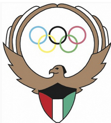
Эмблема Олимпийского комитета Кувейта.