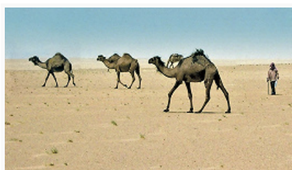
Дромедары в пустыне.