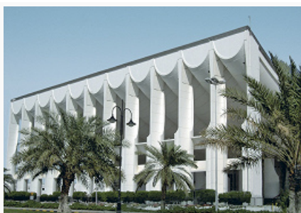
Здание Национального собрания в Эль-Кувейте. 1973–85. Архитектор Й. Утзон.

В период с кон. 3-го тыс. до н. э. до 17 в. н. э. очаги культуры на территории К. были сосредоточены на о. Файлака. К древнейшим сооружениям относятся руины крепости раннего эллинистич. времени с остатками храмов сер. 1-го тыс. до н. э., в архитектуре которых сочетаются др.-греч. и ахеменидские элементы. В Эль-Кусуре были раскопаны руины раннехристианской церкви (кон. 5 – нач. 6 вв. н. э.) с нартексом, галереями и крестообразной в плане часовней; внутри неё обнаружены 2 панели из стукко с орнаментальными мотивами и изображениями креста. В Эль-Курании были обнаружены руины крепости 16–17 вв. При раскопках на о. Файлака найдены также глиняные фигурки всадников т. н. ахеменидского типа, женщин и верблюдов (сер. 1-го тыс.