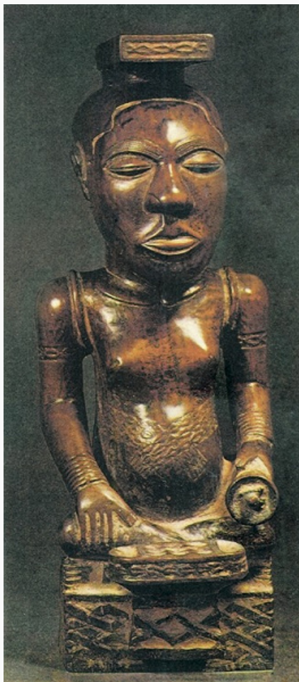
Скульптурный портрет правителя куба Шьям. Дерево. 17 в. Британский музей (Лондон).

Существовали тайные союзы. Сохраняются (в упрощённом виде) обряды инициации. Имеют устную историч. традицию (с особым наследств. хранителем – моариди), мифологию: космогонич., этиологич. и др. мифы; фольклор: сказки о животных, былички и др. Музыка и танцы – обрядовые и развлекательные. Пение (сольное, хоровое) сопровождается игрой на муз. инструментах. Традиц. инструменты – барабаны, музыкальные луки, ксилофоны и др.