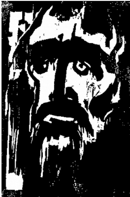
Ксилография. Э. Нольде. «Пророк». 1912.