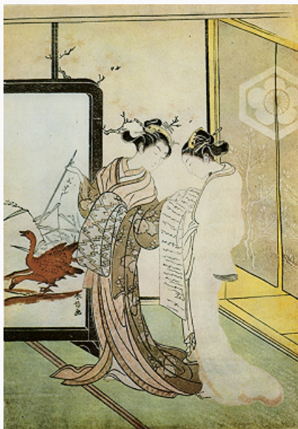
Ксилография. Харунобу Судзуки. «Две девушки с гусями». Сер. 18 в.

Авторы: С. И. Стефанов (техника ксилографии)