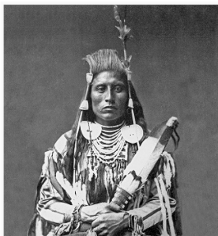
Магическая Ворона (Перитс-Шинакпес), вождь кроу. Фото Ч. Белла (1880). Смитсоновский институт (Вашингтон).

КРО́У (от англ. crow – ворона; самоназвание – апсароке, апсалоке), индейский народ группы сиу на севере США. Численность ок. 9,2 тыс. чел. (2000, перепись); согласно данным Бюро по делам индейцев, 9,8 тыс. чел. (1998), из них св. 7 тыс. чел. – в резервации на юге штата Монтана. Говорят в осн. на англ. яз., св. 4 тыс. чел. (преим. старшего возраста) сохраняют яз. кроу миссурийской ветви сиу языков . Письменность на основе лат. графики. Верующие – баптисты, католики, евангелисты, пятидесятники, более 40% – приверженцы Туземной американской церкви Сев. Америки (пейотисты).