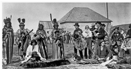
Община вождя кри Большого Медведя торгует в Форт-Питте (Северо-Западные территории). 1884.

В нач. 18 в. часть зап. лесных К. вместе с союзными ассинибойнами стали продвигаться на юго-запад, в степи (совр. провинции Саскачеван, Альберта), составив основу степных, или равнинных, К. (самоназвание – пасквавийиниу, люди прерий). В сер. 18 в. перешли к конной охоте на бизонов и восприняли культуру, типичную для индейцев Великих равнин. Общины возглавляли вожди (окимав), воины каждой общины объединялись в мужской союз. Важнейшая церемония – Пляска Солнца . По договору 1876 степные К. были поселены в резервациях. Многие приняли участие в восстании метисов 1885 под рук. Л. Рия, после разгрома которого часть бежала в США, где в 1916 они получили резервацию.