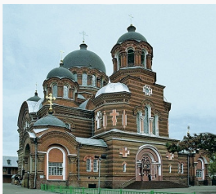
Краснодар. Свято-Екатерининский кафедральный собор. 1900–14.

Основан в 1793 как войсковой город (адм. центр) Черноморского казачьего войска , назван Екатеринодаром в честь имп. Екатерины II. Подчинялся станичному управлению. До сер. 19 в. важнейший форпост Черноморской кордонной линии. Через город проходил Ставропольский шлях – дорога из Ростова-на-Дону в Ставрополь. Первоначально в Екатеринодаре запрещалось селиться и владеть недвижимой собственностью лицам «невойсковых» сословий, население города составляли исключительно казаки. С нач. 1830-х гг. здесь находились также регулярные части рос. армии, участвовавшие в Кавк. войне 1817–64. В городе существовал Меновый двор для обмена товарами с адыгами Закубанья, ежегодно проходили 4 ярмарки: Благовещенская, Троицкая, Преображенская, Покровская. В 1860–1920 адм. центр Кубанской области и Кубанского казачьего войска . В 1867 войсковой статус Екатеринодара упразднён, казачье население обращено в сословие мещан, в городе введено общероссийское гражд. управление (гор. обществ. самоуправление), в нём получили право селиться лица всех сословий. К кон. 19 в. имелось ок. 130 предприятий, в т. ч. металлообрабатывающий завод К. Гусника, кирпичные, винокуренные, кожевенные, чугунолитейный, гончарные заводы, табачная фабрика. Екатеринодар был соединён ж.-д. линиями со станицей Тихорецкая (1887), г. Новороссийск (1888) и станицей Приморско-Ахтарская (1913).