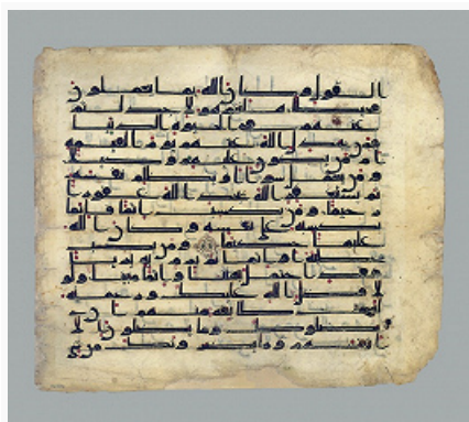
Куфический Коран. 11 в. Северная Африка. Британский музей (Лондон).

КОРА́Н (от араб. аль-куран; букв. – чтение вслух, рецитация), священное Писание мусульман, согласно учению ислама, представляющее собой божественное Откровение, возвещённое миру через Пророка Мухаммеда в Мекке и Медине между 610 и 632. Вместе с дополняющей и разъясняющей его Сунной изречений Пророка образует основу исламского вероучения и права (см. Шариат ). Исламская экзегетика считает К. Словом Божиим, вечный и неизменный оригинал которого (как и всех ниспосланных прежде Писаний) хранится на небесах в «Святохранимой скрижали» («аль-Ляух аль-махфуз»).