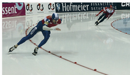
Скоростной бег на коньках. Этап Кубка мира в Коломне (2007).