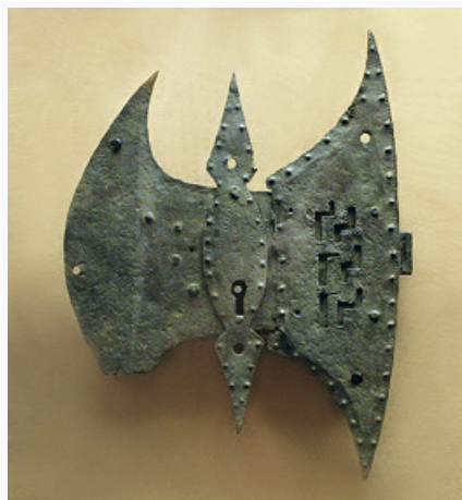
Ковка художественная. Замок секирный. Работа русского мастера 17 в. Художественный музей-заповедник «Александровская слобода» (г. Александров Владимирской обл.).

КОВКА ХУДОЖЕСТВЕННАЯ , вид декоративно-прикладного искусства, произведения которого создаются способом ковки . С 4–3-го тыс. до н. э. в Египте, Месопотамии, Малой Азии известна К. х. меди и метеоритного железа; индейцы Сев. и Юж. Америки знали К. х. самородного железа. В 1-м тыс. до н. э. сложилось иск-во кузнецов Европы, Азии и Африки, обрабатывавших сыродутное железо, медь, серебро, золото; переворот в иск-ве К. х. связан с распространением стали.