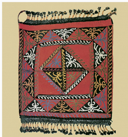
Киргизы. Вышитое панно туш кийиз. Кон. 19 в. Музей антропологии и этнографии (С.-Петербург).

кочевников земледельч. культура приходила в упадок, окончательно была разрушена после монг. нашествия 13 в. В 17–18 вв. навыки поливного земледелия были вновь заимствованы К. у узбеков и таджиков. Земледелием занимались гл. обр. небогатые скотоводы, ведущие полукочевой образ жизни. На юге выращивали хлопок, рис, джугару, бахчевые культуры, на севере – просо и ячмень, с появлением русских – овёс (особенно в высокогорных районах). Для переброски воды через горные ущелья сооружали акведуки (ноо) из выдолбленных стволов. Землю обрабатывали примитивным плугом (буурсун, на юге – амач, омоч). С расселением на севере Киргизии рус. и укр. крестьян (1860–70-е гг.) развивалось богарное земледелие.