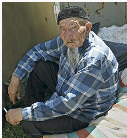
Киргиз из Каракола.

Говорят на киргизском языке . До 20% К. (в осн. в Бишкеке) считают родным рус. яз. Верующие – мусульмане-сунниты. С кон. 20 в. распространяется протестантизм.