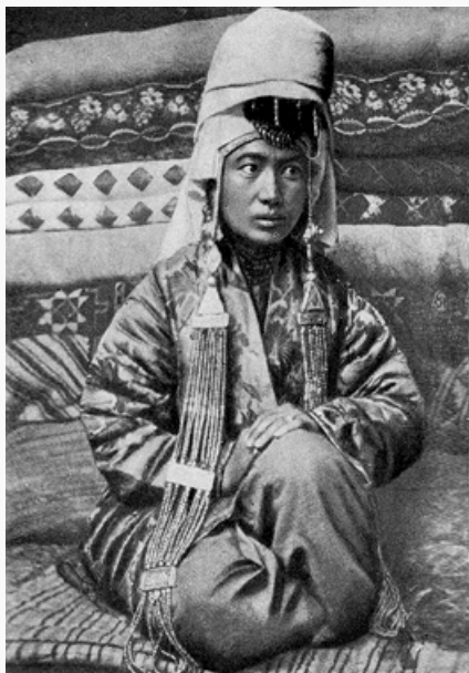
Киргизка в традиционном уборе. Алайская долина.

появляются глинобитные сырцовые и бревенчатые постройки.