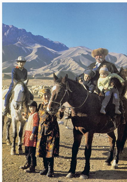
Киргизы. Семья скотоводов.

обл., западе Таласской обл.; тѣбѣй – в Чуйской обл. и на среднем Нарыне; кушчу и саруу – к югу от оз. Иссык-Куль. Группировка ичкилик населяла юго-зап. Киргизию [племена: кесек, ават, кыпчак, найман, бостон, кангды (канглы), нойгут, тейит, тѣолѣс – в Баткенской обл. и на западе и юге Ошской обл.].