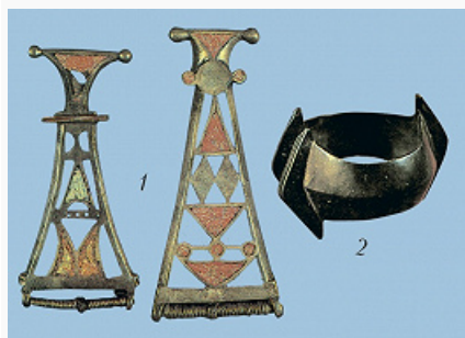
Киевская культура. Бронзовые фибулы с эмалью (1) и браслет (2) изклада на поселении Шишино 5 (по А. М. Обломскому).

В составе К. к. выделяют 4 осн. локальных варианта (см. карту): верхнеднепровский (занимает б. ч. лесного Поднепровья, с отд. памятниками до бассейна Зап. Буга), среднеднепровский (лесостепное Поднепровье до р. Рось на юге), деснинский (бассейны Десны, нижнего и среднего Сейма), сейминско-донецкий (лесостепная часть востока Днепровского Левобережья и бассейнов верхних Сейма, Северского Донца, Оскола). На окраинах К. к. выделяются особые группы: типа Заозерье , Инясево (бассейн р. Хопёр), Сиделькино (Ср. Поволжье). Селища, на севере есть городища. Прямоугольные, углублённые в землю жилища срубной или каркасной конструкции (в лесостепи изредка с глиняной обмазкой), как правило с очагами; в лесной зоне известны печи из камня, а в лесостепной – т. н. печи-камины (в нишах, вырезанных в материковой глине). Грунтовые могильники; трупосожжения на стороне; немногочисленные кости, обычно перемешанные с остатками погребального костра и обломками сосудов, помещали в круглые или овальные ямки; урны и инвентарь редки. Керамика – горшки, миски, корчаги, диски, миски-плошки, миниатюрные сосуды, пряслица (как правило, биконические), грузила; при изготовлении применялся поворотный столик, есть лощёные сосуды, на раннем этапе – специально ошершавленные («хроповатые»); в осн. в лесной зоне (особенно для верхнеднепровского варианта и типа Заозерье) характерна посуда,