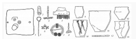
Киевская культура: 1 – план полуземлянки; 2, 3, 5–8 – металлические детали убора: пряжка, фибулы, булавка, подвеска, кольцевидная застёжка (6, 7 – бронза с эмалью); 4 – к...

Причерноморья и черняховской культурой , оттуда вино и др. продукты в амфорах, посуда, фибулы, гребни поступали в Ср. Поднепровье и на Днепровское Левобережье, по всей К. к. – бусы, рим. монеты и др.