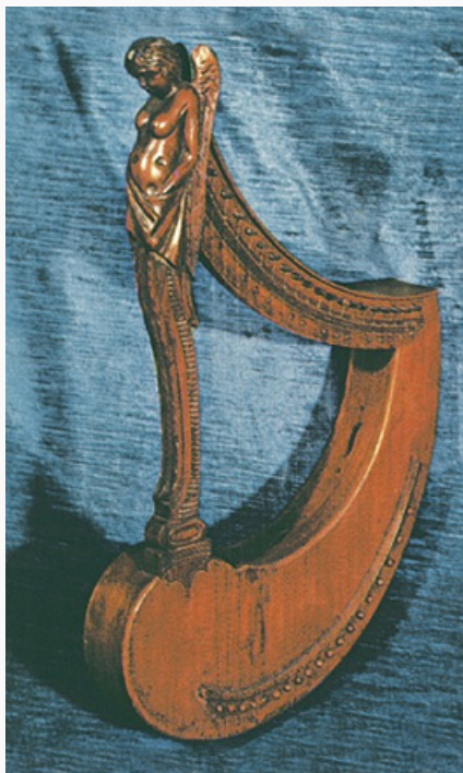
Кельтская арфа «высокоголового» вида.

репертуаре – нар. музыка, произведения О'Каролана и др.). С 20 в., особенно с нач. 1960-х гг., широко используется во многих странах мира для исполнения старинной музыки и для начального обучения игре на педальной арфе. Для К. а. пишут музыку мн. совр. композиторы.