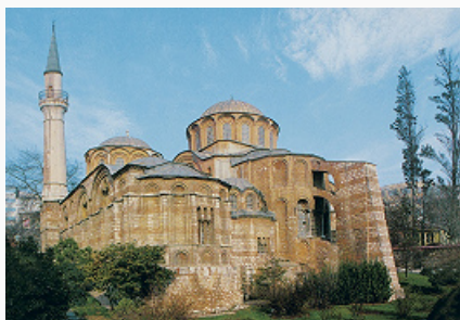
Церковь монастыря Христа Спасителя в Хоре (Кахрие-джами) в Стамбуле. 11– нач. 16 вв.