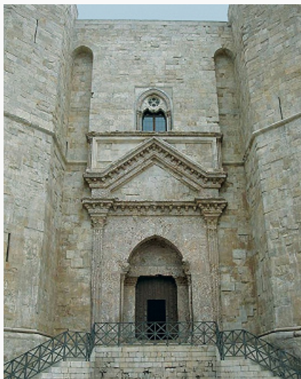
Кастель-дель-Монте. Внутренний двор.

КАСТЁЛЬ-ДЕЛЬ-МОНТЕ (Castel del Monte), памятник истории и архитектуры в Италии, в области Апулия, в 17,7 км от г. Андрия. Возведён имп. Фридрихом II Штауфеном ок. 1240–1250 из местного известняка на высоком холме как одиночное сооружение (см. илл. к ст. Замок ). Имеет в плане правильный восьмиугольник, в центре которого расположен октагональный внутр. двор; на внешних углах замка 8 восьмигранных башен (выс. ок. 24 м). Внутр. пространство разделено на 2 этажа, на каждом – по 8 помещений равной площади со стрельчатыми крестовыми сводами (в т. ч. Тронный зал). Массивные геометрически правильные формы сочетаются с изяществом архит. деталей фасадов и интерьера (карнизы, капители колонн и др.), демонстрирующих подражание античным образцам, характерное для придворной культуры имп. Фридриха II, а также выдающих влияния исламской и сев.-европ. архитектуры (в т. ч. цистерцианской). Неизвестно, строился ли замок как оборонит. сооружение (отсутствуют ров, подъёмный мост, казармы и конюшня) или как одна из резиденций императора. В 1876 приобретён государством. К.-д.-М. – один из наиболее хорошо сохранившихся ср.-век. замков Италии. Включён в список Всемирного наследия .