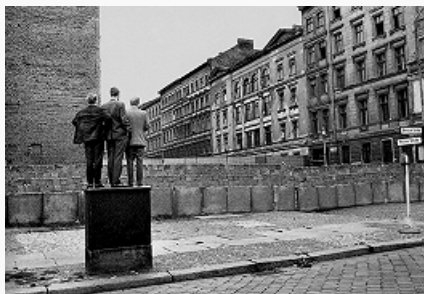
А. Картье-Брессон. «Берлинская стена». 1963.

Он снимал «Лейкой» с 1932; её портативность и высокое качество оптики позволяли делать снимки в самой гуще толпы. Уже в ранних работах (в т. ч. сделанных в Италии и Испании в 1932–1933) К.-Б. привнёс в жанр документальной фотографии непосредственность и «случайность» в сочетании с психологич. напряжённостью. Один из его ранних снимков («Андалусия») кажется фотографич. парафразом картины «Меланхолия и загадки улицы» (1914) Дж. Де Кирико . Первый фоторепортаж К.-Б. появился в 1932 в парижском ж. «Vu»; в дальнейшем его фотографии публиковались в журналах «Arts et Métier Graphiques», «Harper's Bazaar». Фотограф-путешественник, К.-Б. участвовал в этнографич. экспедиции в Мексику в 1934, в 1935 жил в США, где устроил совместную выставку с мекс. фотографом М. А. Браво и впервые обратился к документальному кино (под влиянием П. Стрэнда). Вернувшись во Францию, был в 1936–1939 ассистентом реж. Ж. Ренуара (фильмы «Загородная прогулка», «Правила игры» и др.), снял ф. «Победа жизни» о госпиталях в республиканской Испании (1937).