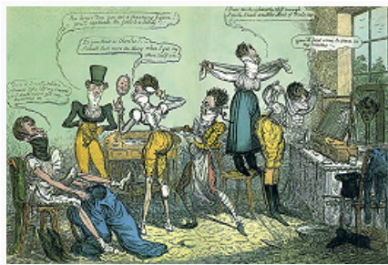
Дж. Круикшанк. «Одевающиеся денди». Цветная литография. 1818.

18 в., «антинаполеоновские» работы Дж. Гилрея и др. в Великобритании и т. д.). В сатирич. офортах Ф. Гойи гротескный язык К. приобрёл небывалую силу и глубину худож. воздействия.