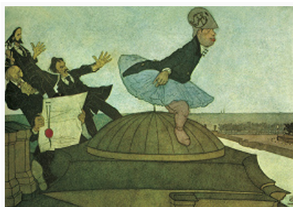
П. Е. Щербов. «Торжество Дзягилева. "Новая Минерва"». Акварель, тушь. 1900-е гг.

На протяжении своей истории К. неоднократно подвергалась гонениям – листы конфисковывались властями, издания запрещались (напр., «Журнал карикатур» А. Г. Венецианова в 1808), художников приговаривали к тюремному заключению и штрафам (О. Домье и др.). О том, что К. не утратила значения и в наши дни, свидетельствуют, в частности, междунар. «карикатурные скандалы» сер. 2000-х гг., спровоцированные обращением художников к религ. тематике; актуальным остаётся иск-во политич. и антивоенной карикатуры.