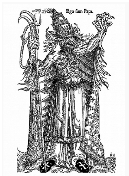
Неизвестный немецкий художник. «Дьявол в виде папы Александра VI». Гравюра на дереве. Ок. 1500.

КАРИКАТУРА (итал. caricatura, от caricare – нагружать, преувеличивать), жанр искусства, изображение, создающее комич. эффект в целях осмеяния и критич. оценки того или иного лица или обществ. явления. К. использует средства сатиры и юмора , шаржа , гротеска и худож. гиперболы ; в ней соединяются реальное и фантастическое, преувеличиваются и заостряются характерные черты фигуры, лица, костюма, манеры поведения людей, применяются неожиданные сопоставления, уподобления и метафоры. Вследствие своей обществ. значимости К. обычно бытует в массовых формах: используются наиболее многотиражные виды графики (первоначально – ксилография, офорт, затем литография, фотомеханич. способы воспроизведения и др.). Осн. формы К. – «летучие листки», нар. картинки, позднее газетно-журнальная графика, плакат, реже сатирич. живопись, скульптура (мелкая пластика).