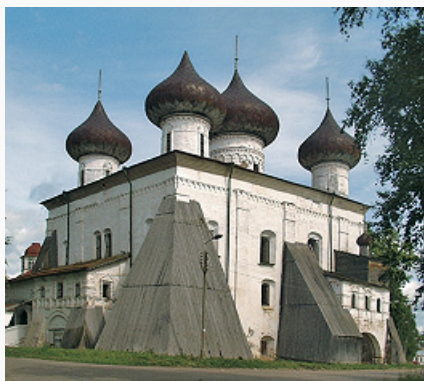
Каргополь. Христорождественский собор. 1552–62. Галереи 17 в.

В янв. 1918, после Окт. революции 1917, в К. мирным путём была установлена сов. власть. К. – уездный город Вологодской губ. (1919–29), районный центр Северного края (1929–36), Северной обл. (1936–37), Архангельской обл. (с 1937). В 1937–40 в К. находилось управление Каргопольлага, заключённые которого занимались в осн. лесозаготовками. В 1970-е гг. к западу от К. построен аэропорт (ныне почти не функционирует).