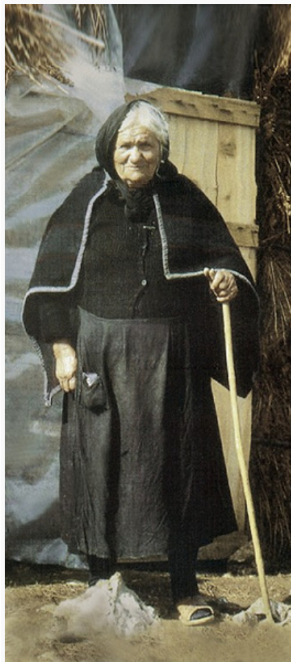
Старая каракачанка. Фессалия. Фото Ф. Капсалиса. 1984.

горах Мицикели. Эпир. Фото Ф. Капсалиса. 1970.