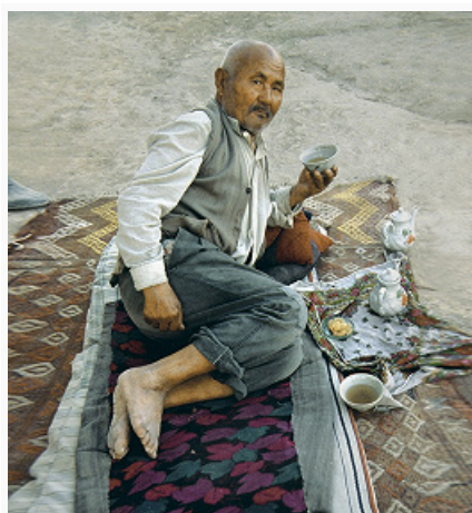
Каракалпак. Фото 2005.

Аулы делились на группы усадеб, населяемых родовым подразделением (коше); к ним примыкали родовые кладбища с гробницей (мазаром) покровителя рода. Знамениты мавзолей Токмак-Ата и Хаким-Ата на острове на юге Аральского м., Султан-Баба в горах Султан-Уиздаг, Шылпык в Амударьинском, Шамун-Наби и Мазлумхан-Сулу в Ходжейлинском р-не и др. На севере застройка аула была более компактной. Для защиты от набегов сооружали крепости (кала). Усадьба (хаули) обносилась глинобитной стеной. Осн. традиц. жилище – юрта (кара уй); характерен конич. свод. Постоянное жилище (там) глинобитное. От входа внутрь дома идёт коридор (дализ), куда выходят жилые помещения (ожире), кладовая, крытый двор (уйжай) с юртой и расположенный сзади хлев (сейисхана).