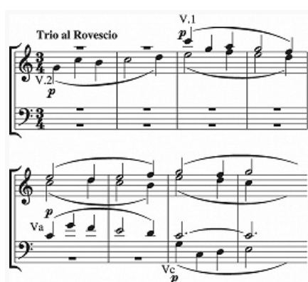
1. Двойной 4-голосный канон в обращении. В. А. Моцарт. Струнный квинтет К 406, 3-я часть.

КАНО́Н в музыке, 1) полифонич. форма, в которой мелодия (одна или несколько) образует контрапункт сама с собой. Технически чаще всего основывается на последовательно проводимой (канонической) имитации , когда мелодия в каждом имитирующем голосе вступает до того, как она закончилась в др. голосе. Начинаящий голос канонич. имитации называется пропостой (P), имитирующие – респостами (R):