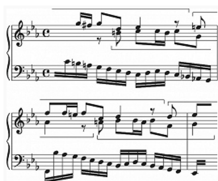
2. 2-голосная каноническая секвенция в сопровождении свободного голоса. И. С. Бах. «Хорошо темперированный клавир», том I, фуга c-moll.

К. обычно 2–4-голосны, хотя число голосов теоретически неограниченно. Голоса К. могут вступать в разл. интервалы (в приму, октаву, кварту и др.) и в разл. порядке, в частности одновременно (см. пример 3б). По числу имитируемых мелодий различаются простые и сложные (двойные, тройные) К. Помимо имитации в прямом движении, в К. возможно обращение мелодии, ракоход , увеличение , уменьшение и др. преобразования.