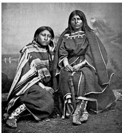
Женщины кайова. Форт-Силл, 1869–72.

охотиться на огромной территории юга Великих равнин (запад штата Канзас и совр. штат Оклахома, восток штата Колорадо, север штата Техас). В 1-й пол. 19 в. оттеснены чейеннами и дакота на юг, за р. Арканзас.