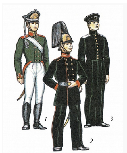
Кадеты: 1 – 1-го кадетского корпуса. 1812; 2 – Новгородского графа Аракчеева кадетского корпуса. 1856; 3 – Морского корпуса. 1860.

КАДЕ́ТСКИЕ КОРПУСА́ (от франц. cadet – младший), привилегиров. средние военно-учебные заведения закрытого интернатского типа. Ведут своё начало от прус. кадетских школ, созданных во 2-й пол. 17 в. для подготовки детей дворян к воен. службе. Позднее кадетские школы (корпуса) появились во Франции и Дании. В России в 18–20 вв. К. к. служили для подготовки детей дворян к воен. и гос. службе. В 1-й пол. 20 в. К. к. имелись в Германии, Японии и Черногории.