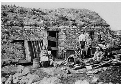
Ирландская семья у дома. Фото 1890-х гг.

Авторы: Т. А. Михайлова; Я. Гардзонио (устное творчество)