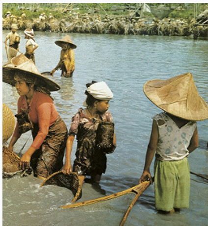
Женщины ловят рыбу корзинами.