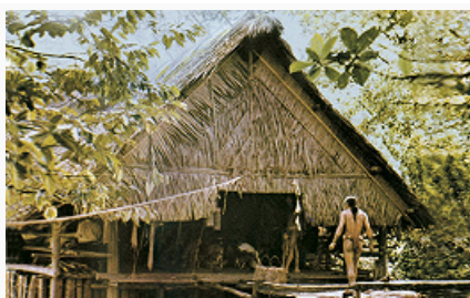
Свайное жилище ментавайцев.

Среди И. выделяются неск. хозяйственно-культурных типов. Наиболее архаична культура немногочисл. племён бродячих охотников и собирателей, сохраняющихся во внутр. районах больших островов Зап. и Вост. Индонезии ( кубу , лубу, акиты, утаны Суматры, пунаны Калимантана, тоала Юж. Сулавеси, нуаулу Серама, тогутил Хальмахеры, гурнгаи о-вов Ару, манге о-вов Сула и др.). Некоторые из них обладают негроидными (меланезийскими) и австралоидными признаками, очевидно, восходящими к доавстронезийскому населению архипелага. Говорят на этнолектах австронезийских языков соседних народов. К ним близки по культуре азта Филиппин и асли Малаккского п-ова. На крайнем востоке Индонезии – в низменных районах Молуккских о-вов и Новой Гвинеи распространён хозяйственно-культурный тип добывателей саго (б. ч. южномолуккских народов и папуасов). Большинство народов Вост. Индонезии (осн. масса бима-сумбанских и тиморских, часть южномолуккских, северохальмахерских и южнохальмахерских народов) занимаются ручным подсечно-огневым возделыванием корнеплодов и клубнеплодов (таро, ямс, позднее также маниок и батат), в колониальное время – кукурузы.