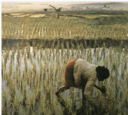
Возделывание заливного риса. Ява.

стороны общеиндонезийской культуры и втягиваются в социальное и экономич. развитие страны. В кон. 19 в. началось массовое обращение их в христианство, часть сохраняет традиц. верования в рамках «индуизма»; обращение в ислам, как правило, вело к их ассимиляции.