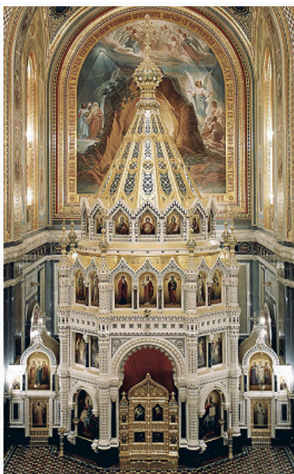
Иконостас храма Христа Спасителя в Москве. Воссоздан в кон. 1990-х гг.

(Литургия св. Василия Великого и Литургия св. Иоанна Златоуста); в ней упоминаются все чины святых И., объединённые с молящимися милостью и благодатью Божией. И. лицевой стороной, иконами, обращён к средней части храма, где верующие, оказываясь лицом к лицу со своими небесными заступниками, возносят молитвы к Христу, Богородице, ангелам, святым. Происходит единение Церкви Небесной и земной – Церковь предстаёт во всей полноте. Помимо литургического, в И. присутствуют церковно-историч., эсхатологич., прообразовательный и символич. аспекты.