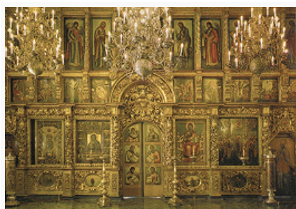
Иконостас собора Двенадцати Апостолов в Московском Кремле (перенесён из разрушенного собора Вознесенского монастыря в Кремле в 1929). Кон. 17 в. (иконы – 17–18 вв.).

В сер. 17 в. патриарх Никон реформировал И. по греч. образцу, повелев заменить иконы отцов Церкви и мучеников в деисусном ряду изображениями 12 апостолов, а также упорядочить расположение икон местного ряда: икона Спасителя должна была располагаться справа от царских врат, справа от неё – храмовый образ, слева от врат – икона Богородицы. Первый И. подобного вида изготовили для Успенского собора Московского Кремля (1653). В состав деисусного ряда вошли апостолы Пётр, Павел, 4 евангелиста и ещё 6 апостолов из числа первых учеников Христа. Большой Московский собор 1666–67 постановил завершать И. Распятием с предстоящими (резным или обрезным по контуру). Во 2-й пол. 17 в. в И. появился дополнит. верхний ряд (или ряды) «Страстей Христовых». Под изображениями апостолов деисусного ряда в некоторых храмах помещали иконы с апостольскими страданиями, на тумбах под местным рядом – «еллинских мудрецов» (философов и сивилл), по преданию, пророчествовавших о Христе, или сцены из синодиков.