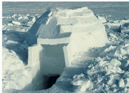
Иглу (внешний вид).