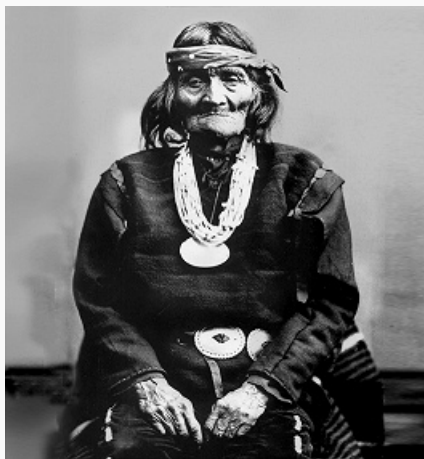
Педро Пино, «губернатор» пуэбло Зуни в 1840–50-х гг. Штат Нью-Мексико. Фото Дж. К. Хиллера. 1879. Смитсоновский институт (Вашингтон).

(сер. 19 в.) незначительно повлияло на З. В 1877 была образована резервация, включившая ядро их традиц. территории. До нач. 20 в. власть осуществлял совет 6–7 старших жрецов, ежегодно назначавший «губернатора» и его помощников. В нач. 20 в. в совете жрецов образовались две фракции: консервативная («католическая») и прогрессивная («антикатолическая»). С 1934 управляются выборным племенным советом. В 1970 (первыми из индейцев США) приняли племенную конституцию, управление резервацией полностью перешло от федерального Бюро по делам индейцев (БДИ) к «губернатору» и племенному совету.