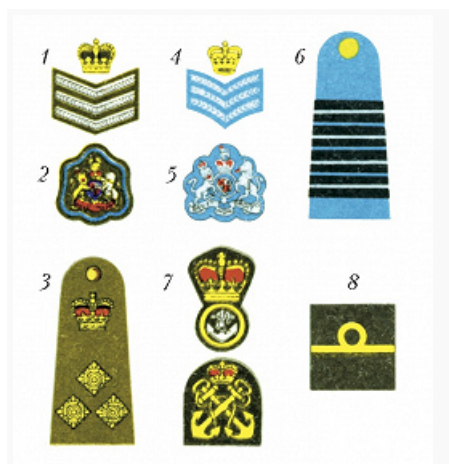
Знаки различия военнослужащих Вооружённых сил Великобритании.

состава и упразднением воинских званий инж.-технич. состава, адм., интендантской и технич. служб.