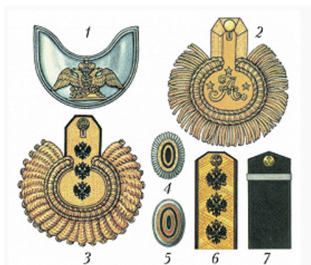
Знаки различия военнослужащих российской императорской армии: