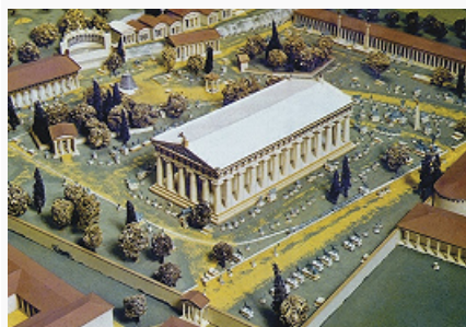
Реконструкция святилища в Олимпии. В центре — храм Зевса.

ЗЕ́ВСА ХРАМ В ОЛІ́МПИИ, памятник др.-греч. культовой архитектуры, центр святилища Зевса. Возведён в Олимпии между 470 и 456 до н. э. архитектором Либоном из Элиды. Представляет собой периптер дорического ордера (по 6 колонн вдоль коротких сторон и по 13 — вдоль длинных) со стилобатом (27,68 × 64,12 м). Построен из местного известняка, колонны были покрыты мраморной штукатуркой для последующей раскраски. План сформирован на основе модуля, равного длине интерколумния (5,22 м). Высота колонн (10,51 м) почти совпадает с высотой колонн Парфенона (10,43 м), для которого 3. х. в О. послужил образцом. Скульптурный декор храма (ныне в Археологич. музее, Олимпия, и в Лувре, Париж) является центр. памятником ранней классики . Фронтонные группы (представляющие миф о Пелопе на вост. фронте и кентавромахию на западном) были созданы в 468—456 до н. э. Рельефные метопы целлы (по 6 на её торцовых сторонах) представляют подвиги Геракла. Акротерии выполнены во 2-й пол. 5 в. до н. э. с участием известного скульптора Пеония. В 438 до н. э. скульптор Фидий создал для 3. х. в О. 12-метровую статую Зевса в Олимпии в хрисозлефантинной технике (см. Хрисозлефантинная скульптура ), названную впоследствии одним из семи чудес света . По указу имп. Феодосия II (426 н. э.) началось разрушение языческих святилищ Олимпии, довершённое землетрясениями 6 в. С 1875 ведутся систематич. исследования руин храма.