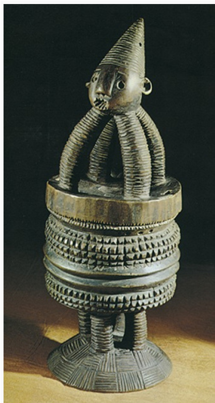
Занде. Сосуд для краски. Дерево. Музей антропологии и этнографии (С.-Петербург).