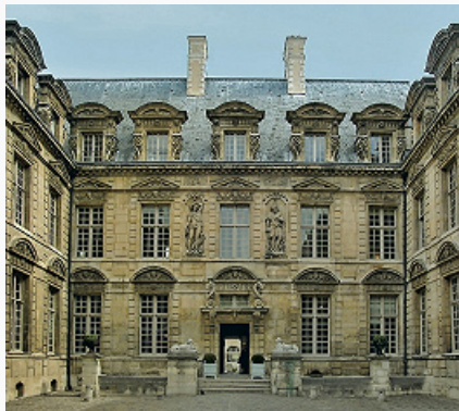
Жан I Андруэ Дюсерсо. Внутренний двор Отеля Сюлли в Париже. 1624–29.