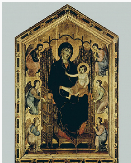
Дуччо ди Буонинсенья. «Мадонна Руччелаи». 1285. Галерея Уффици (Флоренция).