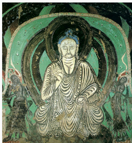
Дуньхуан. Часть настенной росписи пещеры 254. Между 439 и 534.

ДУНЬХУА́Н, историч. город в зап. части пров. Ганьсу (Китай). Нас. 127,5 тыс. чел. (2007). Основан по приказу имп. У-ди в 111 до н. э. как центр одноим. округа. С 317 н. э. Д. входил в состав разл. государств, возникавших на севере Китая, в 400 стал столицей гос-ва, созданного Ли Гао и разгромленного сюнну в 420. В 421 Д. заняли войска кит. гос-ва Сев. Лян, в 439 область вошла в состав Сев. Вэй, в 557 – Сев. Чжоу. В конце 6 в. провинция Д. стала частью империи Суй , в 605–609 сюда была направлена комиссия для изучения возможностей торгового пути на запад. К 640 Д. был включён в состав империи Тан . В 781 Д. и ряд др. земель захватили тибетцы (тобо). В 848 они были изгнаны в результате войны, начатой местным богачом Чжан Ичао, основавшим в 866 династию правителей Д.; в 907, после падения империи Тан, Чжан Чэнфэн создал здесь гос-во, но в 911 стал вассалом уйгурского гос-ва Кочо. С 1036 Д. контролировали племена зап. цзянов , затем – гос-во тангутов Зап. Ся. В 1227 Д. захватили монголы, в 1271 город включён в гос-во Юань (с 1281 часть пров. Ганьсу). С 1403 в составе гос-ва Мин ; после закрытия Китая для иностранцев Д. в 1524 потерял значение важного перевалочного пункта. Был одним из узловых пунктов Великого шёлкового пути , одним из центров буддизма. Правители Д. обладали большой степенью независимости, особенно в периоды ослабления или распада империй.