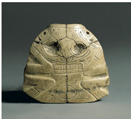
Подвеска в виде маски. Кость. Культура Таино. 13–15 вв. Метрополитен-музей (Нью-Йорк).