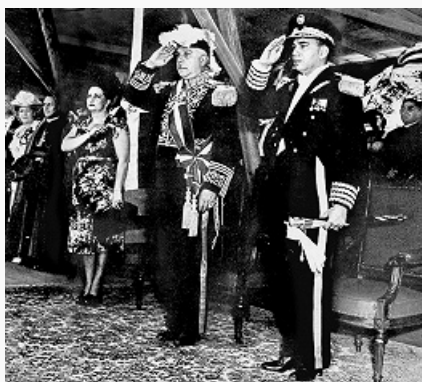
Президент Р. Трухильо Молина (в центре), его брат генерал Э. Трухильо Молина (справа) принимают парад в день инаугурации 16 августа 1947.