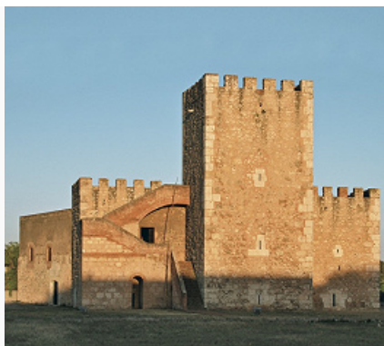
Санто-Доминго. Башня-донжон крепости Торре-дель-Оменахе. Архитектор К. де Тапиа. 1503–07. Фото А. И. Нагаева