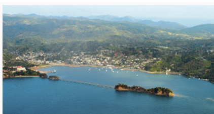
Вид на бухту Самана.