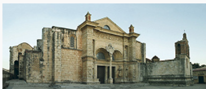
Санто-Доминго. Церковь Санта-Мария-де-ла-Энкарнасьон. 1521–38.