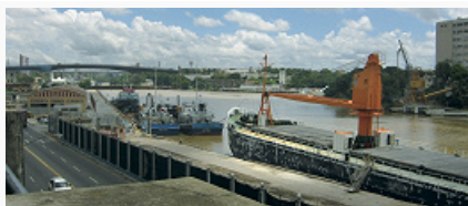
Санто-Доминго. Вид портово- промышленной зоны.