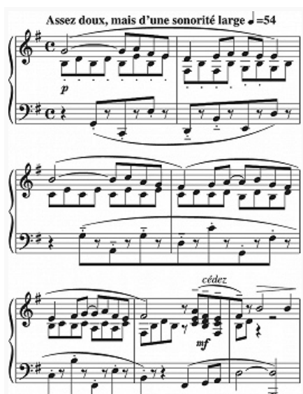
М. Равель. Павана на смерть инфанта (1899).

Структура древней (античной, средневековой) Д. была строго квинтовой (в связи с пифагоровым строем). По мере развития аккордово-гармонич. системы Д. структурно реорганизовалась, стала квинто-терцовой (на схеме – соответствует квинте, // – терции):