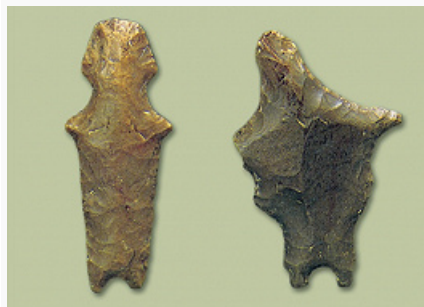
Кремнёвые антропоморфные изображения. Стоянка Волосово.

Сер. 3-го тыс. до н. э. (по С. В. Студзицкой). Исторический музей (Москва).